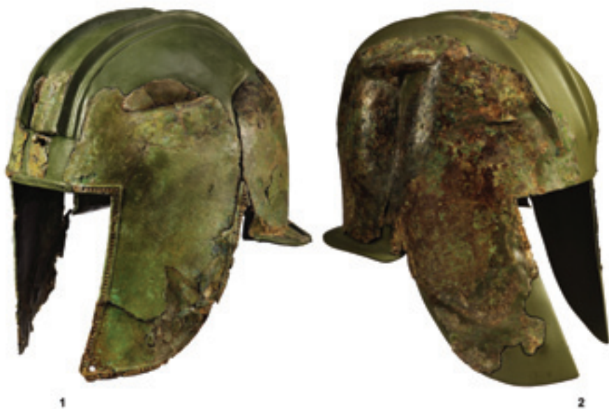
Sl. 3. Ilirske kacige iz groba VII/19 na Kapiteljskoj njivi u Novom Mestu (prilagođeno prema Križ 2012)