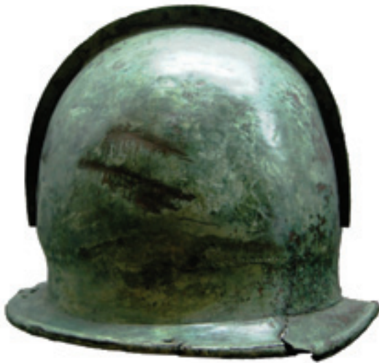
Sl. 6. Lijeva strana hibridne negovske kacige iz Krka, Šinigoj (prema Blečić Kavur 2010)