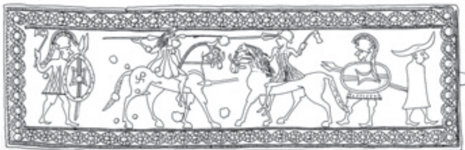
Sl. 5. Vače, ukrasna pojasna kopča s pravokutnom, dvodjelnom okovnom pločom ukrašena u maniri situlske umejtnosti (prema Turk 2005)