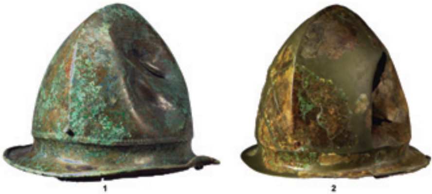
Sl. 4. Negovske kacige iz Novog Mesta, 1 – Kandija, grob VI72 2 – Kapiteljska njiva, grob VII/35 (prilagođeno prema Križ 2012)