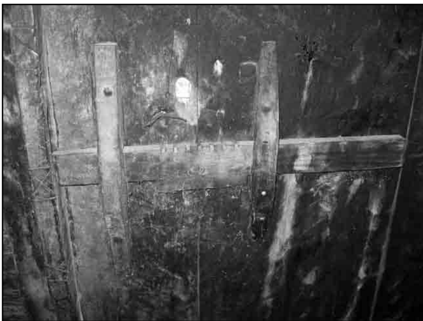
Слика 4. Дрвена кључаница