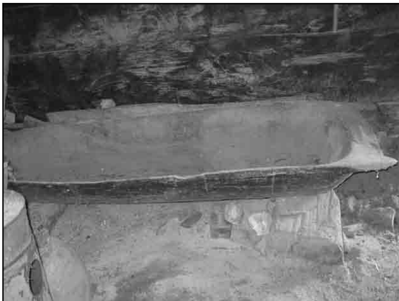
Слика 9. Нашее