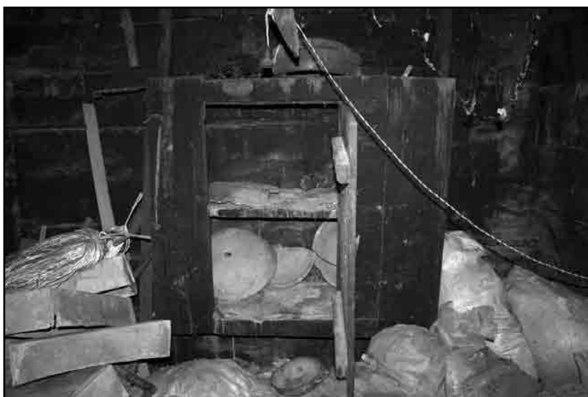
Слика 6. Долап