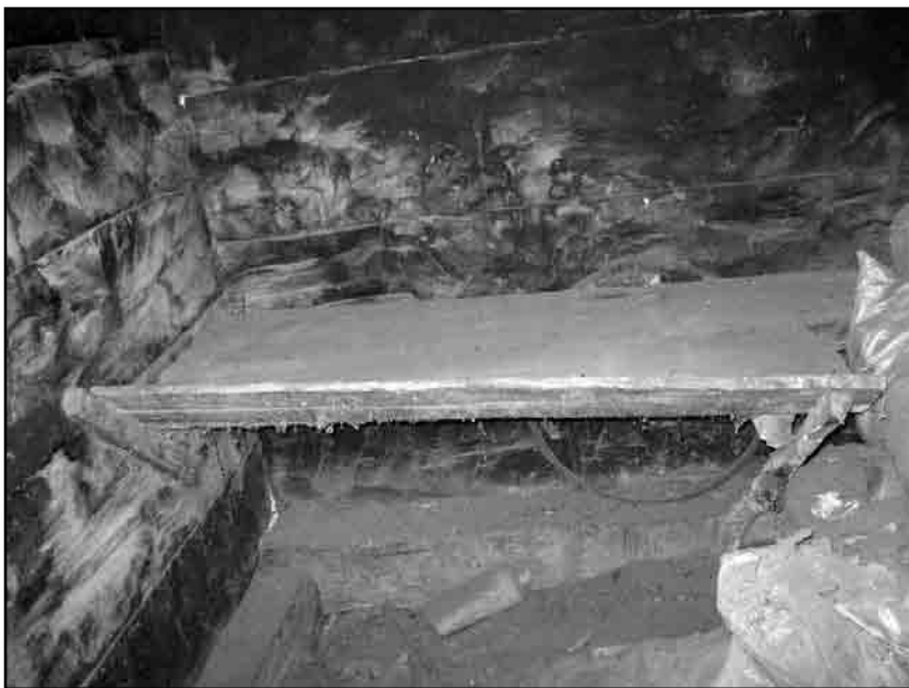
Слика 7. Јасле