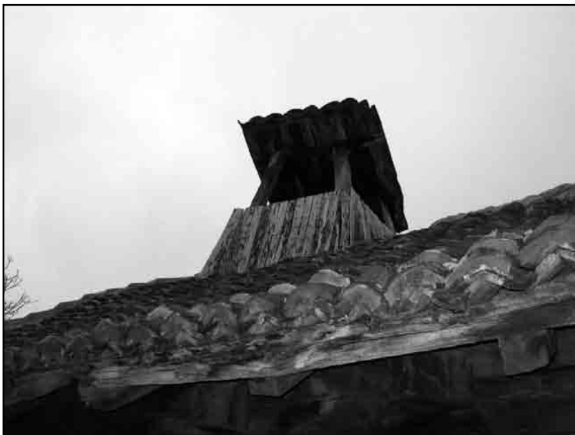
Слика 3. Капић са дрвеним стубићима