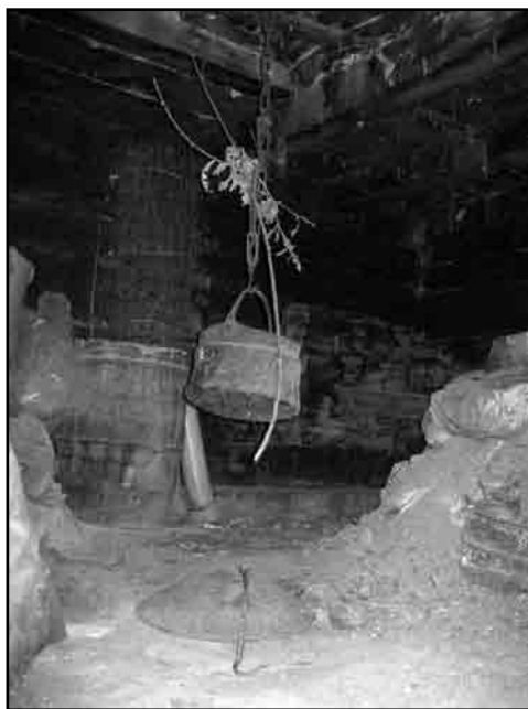
Слика 8. Огњиште