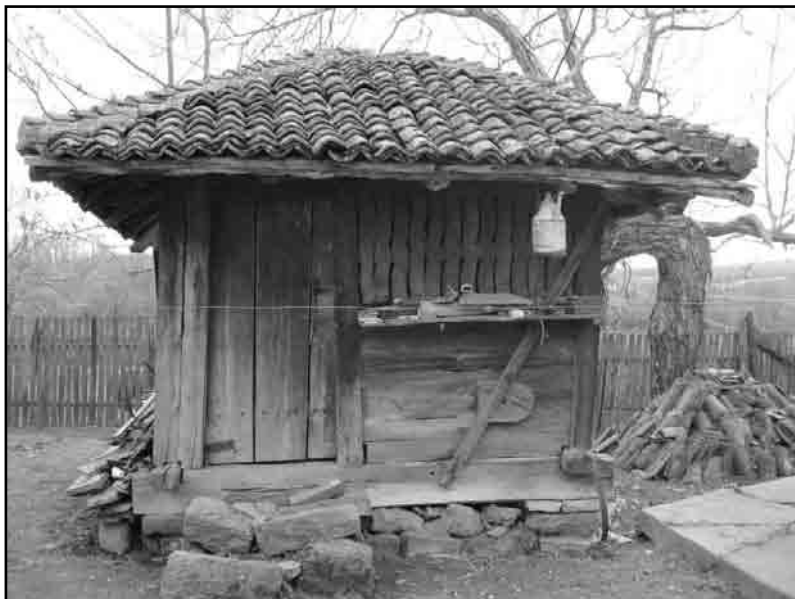
Слика 10. Изглед млекара