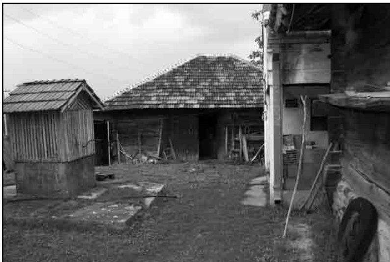
Слика 11. Изглед качаре