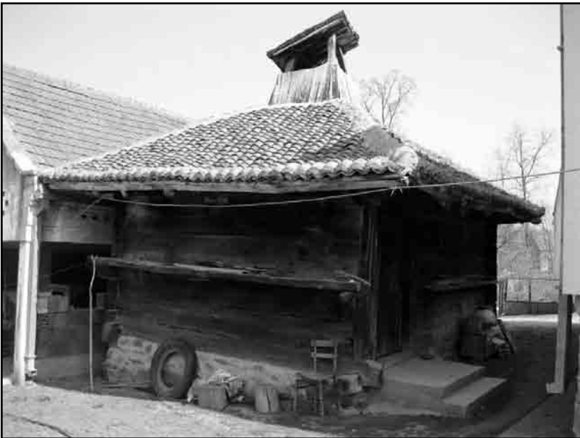
Слика 2. Садашњи изглед брвнаре