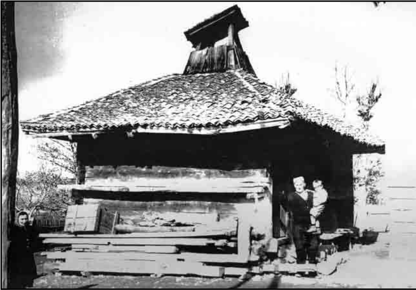
Слика 1. Изглед брвнаре 1968. године