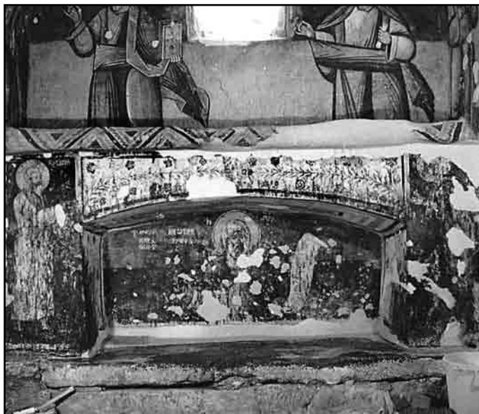
Слика 1. Гроб праведног Јова, манастир Драча, 1970.