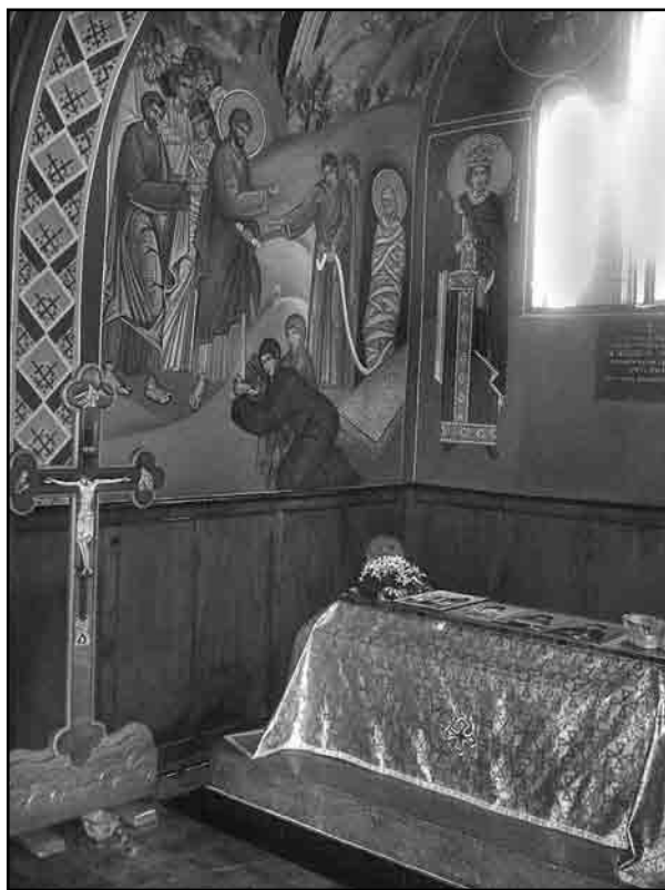
Слика 4. Свечев гроб у цркви манастира Дивостин, 2014.