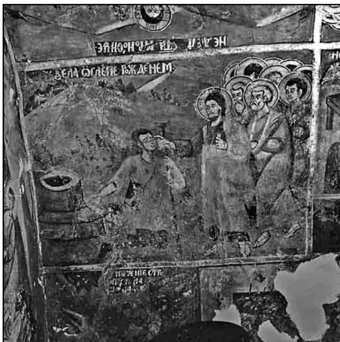
Слика 2. Исцељење слепог, манастир Драча, 1970.