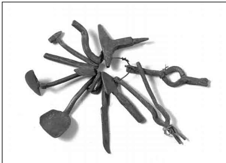
Слика 7. Амајлија Е-1400