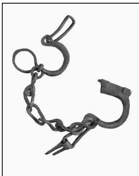
Слика 6. Коњске букагије E-101