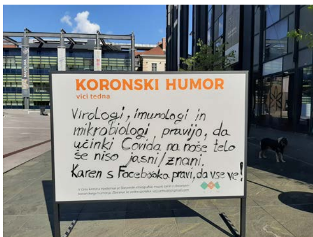
Слика 1. Изложба Корона хумор, Словеначки етнографски музеј Фото: Тијана Јаковљевић-Шевић, Љубљана, август 2020.