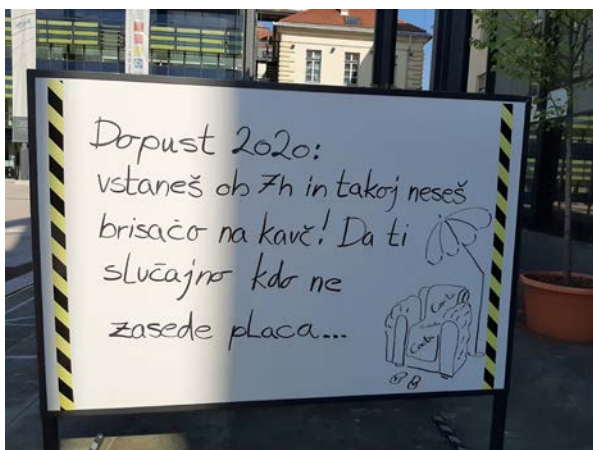
Слика 2. Изложба Корона хумор, Словеначки етнографски музеј Фото: Тијана Јаковљевић-Шевић, Љубљана, август 2020.