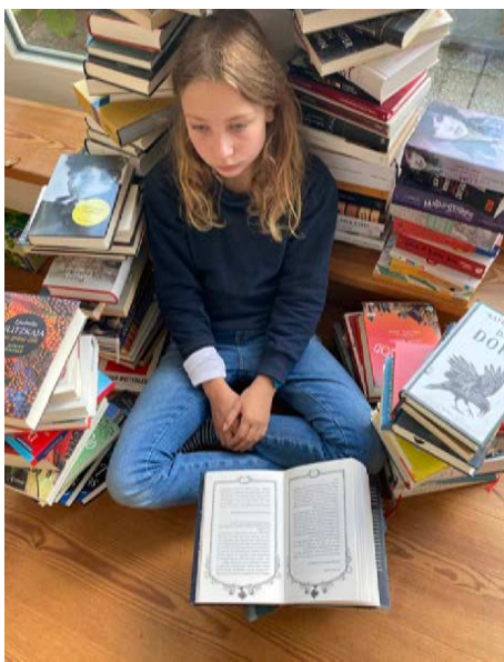
Слика 5. Акција ... И онда је Корона дошла на врата... , Регионално-интернационални музеј женске културе