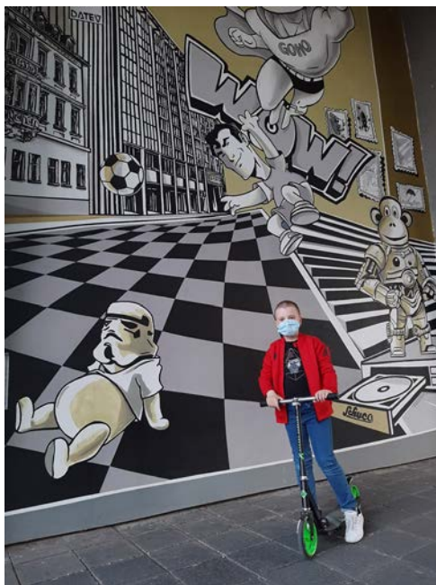
Слика 4. Акција ... И онда је Корона дошла на врата... , Регионално-интернационални музеј женске културе