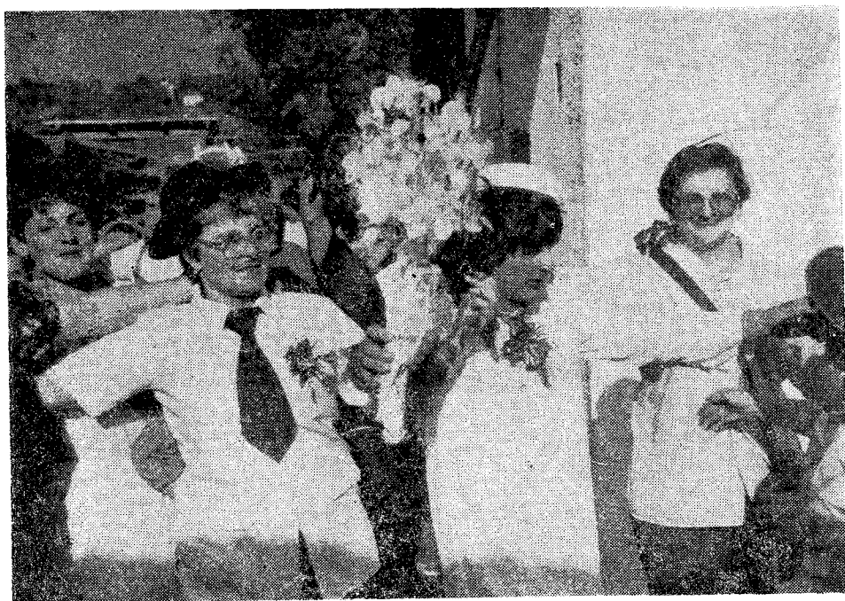
„Младожења“ (тј. свекрва) и „невеста“ (тј. свекар), управо „венчани“, хватају се у разиграно коло

чађу или каквим другим „белилом“, а све чешће и шминкају модерним козметичким препаратима, каче око врата ниску прапораца уместо ниске дуката, дају букет коприва, боца, смрдљевка или каквог другог корова уместо цвећа, што све зависи од маштовитости оних који свекра-младу опремају за венчање.