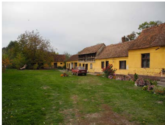
Слика 6. Традицијска просторна структура пољопривредног домаћинства, Богатић