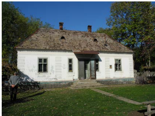
Слика 3. Старија зидана кућа, пре средине 20. столећа, Очаге