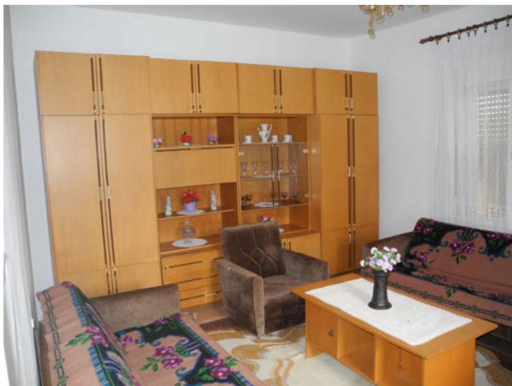
Слика 7. Ентеријер сеоске куће из друге половине 20. столећа, Бадовинци