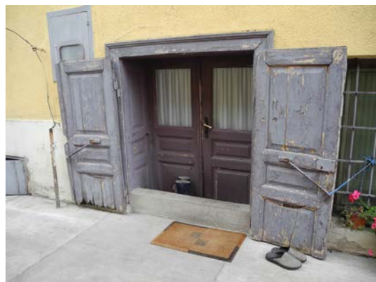
Слика 5. Употреба подрумских просторија у стамбене сврхе, Мачвански Прњавор