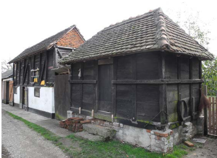
Слика 2. Очуване старије економске зграде млекар и чардак, Очаге