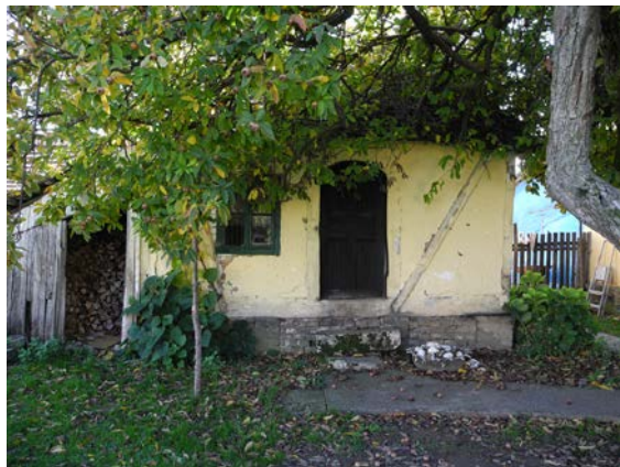
Слика 1. Старија кућа грађена у бондручном систему, Црна Бара