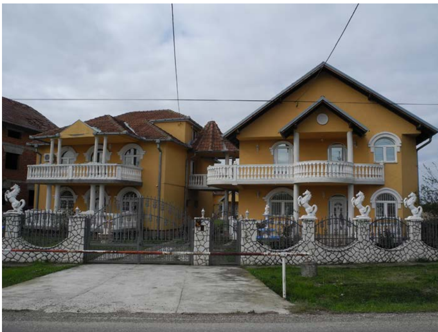
Слика 9. Модерна кућа грађена почетком 21. столећа, околина Богатића