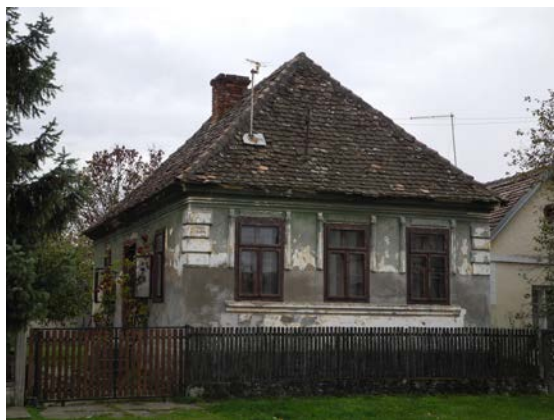
Слика 4. Новија зидана кућа из друге половине 20. столећа, Црна Бара